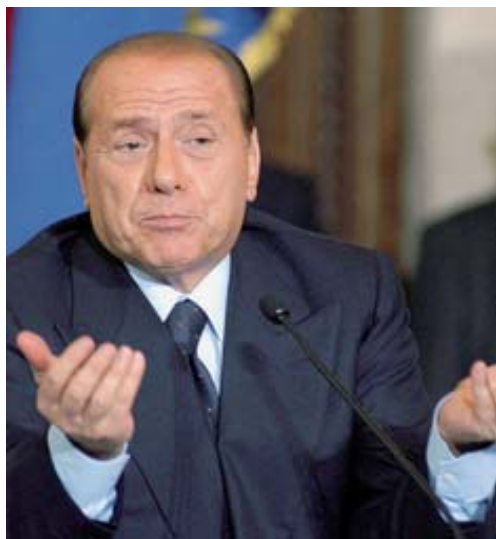
Nel mirino Silvio Berlusconi, il presidente del consiglio

BOLZANO — Il Centro per la pace organizza una serata di riflessione sul diritto all'acqua e sulla realtà delle politiche di privatizzazione dei beni essenziali che provocano un impoverimento delle comunità in tanti stati del Sud del mondo. A Palazzo Altmann in piazza Gries 18 verrà proiettato il documentario «Terra d'acqua» frutto di un progetto di cooperazione internazionale tra l'associazione «Filorosso» di Trento e la Casa «Bertolt Brecht» di Montevideo in Uruguay.