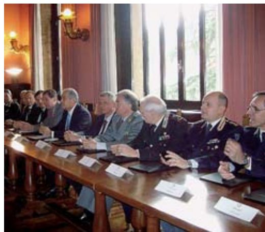
Patto | vertici delle forze dell'ordine alla firma della permuta

«Tale risultato — è stato detto — è anche l'esempio dell'ottimale collaborazione tra Stato - Provincia - Comuni finalizzata a garantire stabilmente alle forze dell'ordine strutture funzionali sul territorio tramite l'utilizzo di beni demaniali disponibili e quindi una operatività più rispondente alla sicurezza della cittadinanza».